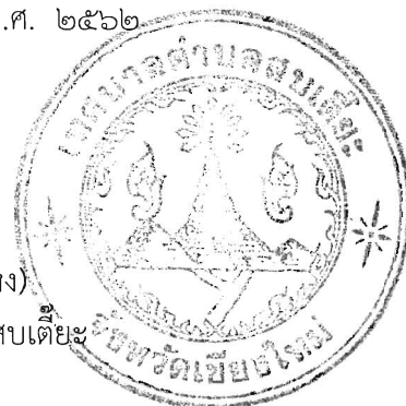
(นายสมบัติ ทองแหง) นายกเทศมนตรีตำบลสบเตี๊ยะ

ประกาศ ณ วันที่ ๑๑ เดือน มีนาคม พ.ศ. ๒๕๖๒